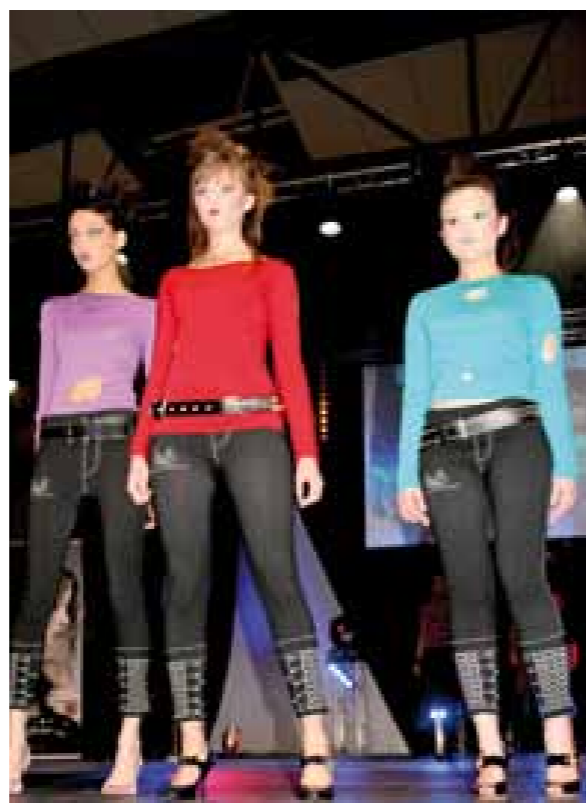
Show Art Libre Padiglione

Belles performances d'Art Libre Padiglione pour son show « Underground » qui a donné une version actuelle et subtilement décalée du chignon. Les Hair Designers Matrix France ont aussi présenté un show élégant et tonique.