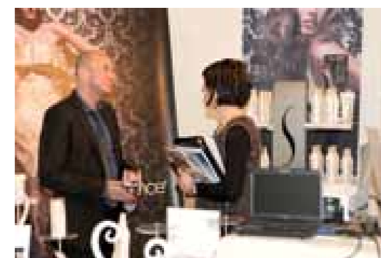
Senscience chez Distri-Coiff