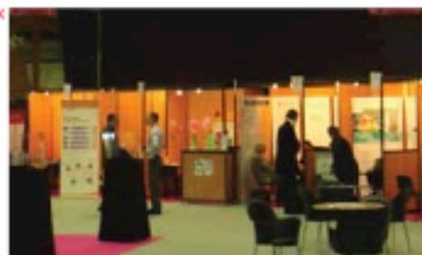
Cosmetic Valley juntou profissionais de Perfumaria e Cosmética

No dia cinco, teve lugar uma noite de gala, no colégio de Santo André, em Chartres, que permitiu o convívio entre os vários participantes no evento.