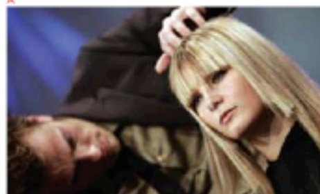
Diversos shows e concursos animaram este evento